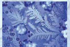
nach der Behandlung

Gönnen Sie sich Quellwasser-Qualität aus Ihrer Wasserleitung. Den Wasser-Impuls-Generator gibt es für den einzelnen Wasserhahn und als Anlage für das ganze Haus.